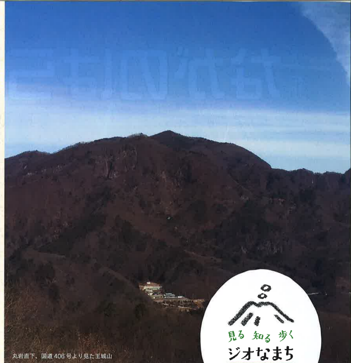
丸岩直下、国道406号より見た王城山