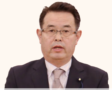
ほしかわ あきひこ 星河 明彦 議員