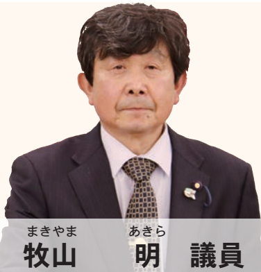
まきやま あきら 牧山 明 議員