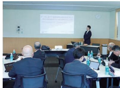
▲議会改革特別委員会の様子

研修では、実際にデータ収集についての操作や、例としたデータから課題の設定、取るべき対策について長野原町の強みや弱みをデータから考えてみるといった過程で進められました。