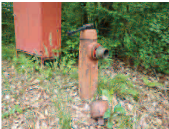
▲受理番号9号 消火栓の新設や修繕について (写真：老朽化のため開閉弁操作不可)