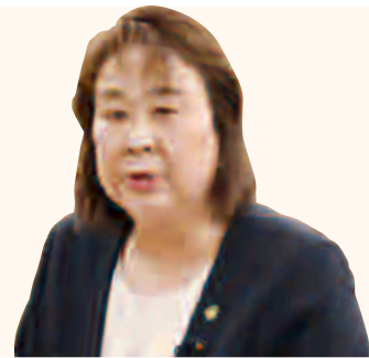
はぎわら ひろみ 萩原 広美 議員