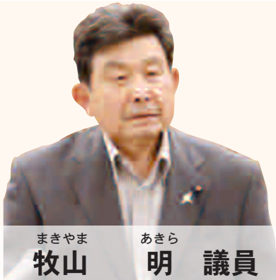
まきやま あきら 牧山 明 議員