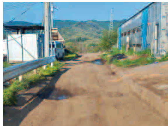
▲受理番号10号 舗装補修についてのお願い (写真：町道10-14号線)