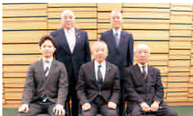
総務文教常任委員会