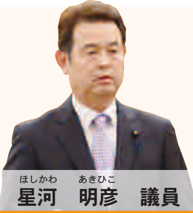
ほしかわ あきひこ 星河 明彦 議員