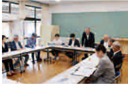
▲中央こども園で説明を受ける様子