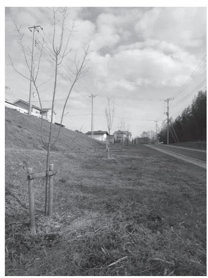
一本松地区に植樹された桜

答 町長 国が主体で進めている。とても見栄えの良い事業だが、実際には町民の負担になるのではないかと感じられるので、注視していきたい。 ただ、これからの地域を救うのは、ボランティア精神だと思っているので、一丸となって桜を守ってほしい。