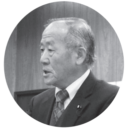
篠原 茂 議員