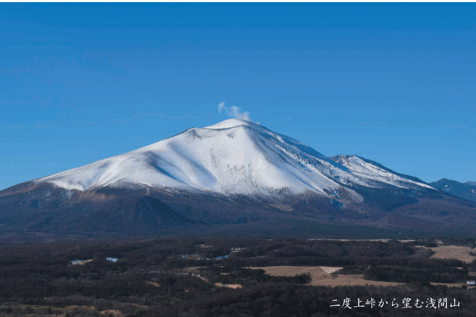
二度上峠から望む浅間山