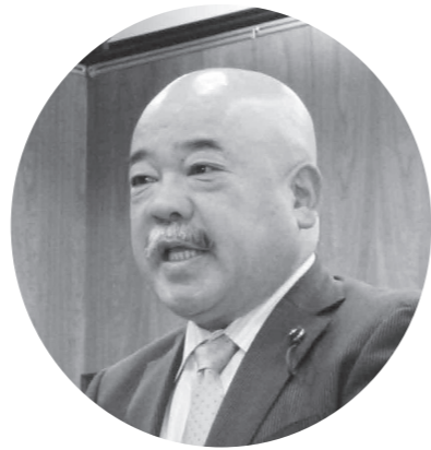
黒岩 巧 議員