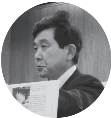
牧山 明 議員