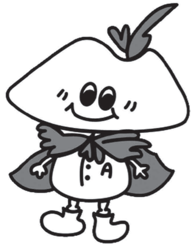
浅間山ジオパークマスコットキャラクター あさマン