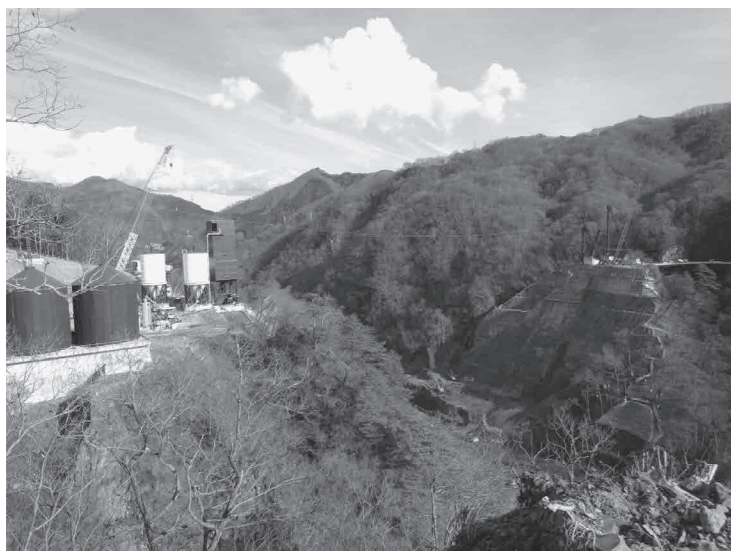
やんば見放台から望むダム本体建設現場

人体に影響が出てからでは取り返しがつかない。町民の生命、財産を守るためにも、積極的な調査と明確な対策方針を