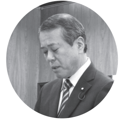
浅沼 克行 議員