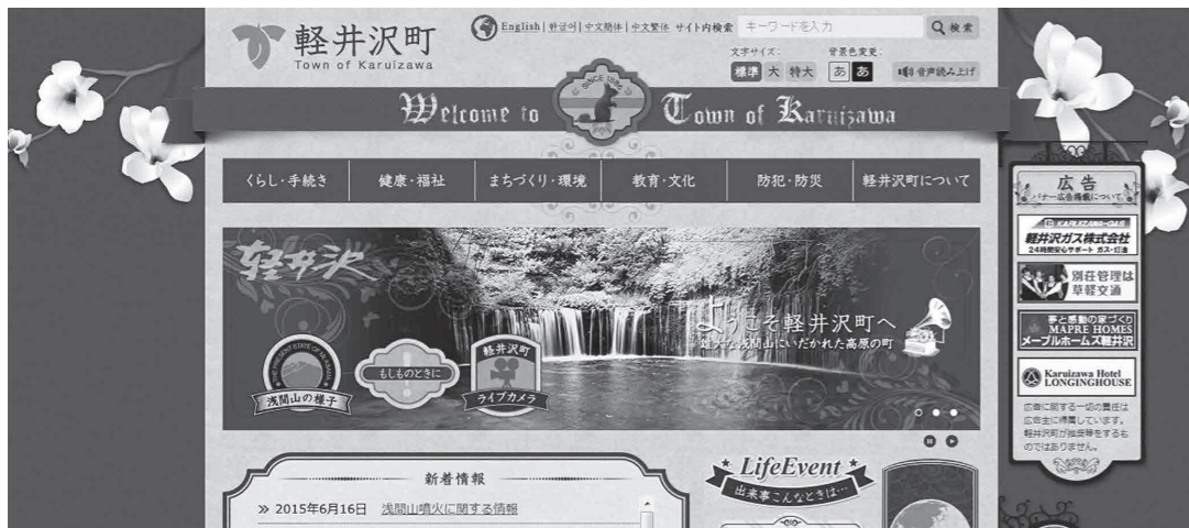
軽井沢町ホームページ